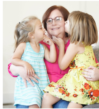
بعد از تولد طفل تان