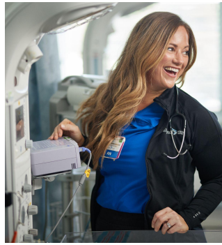
هنگامیکه باردار هستید