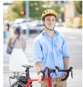
هنگامیکه بچه های شما بزرگتر هستند