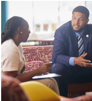
قبل از بچه دار شدن