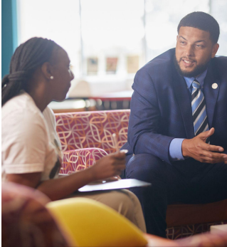
له دې وړاندې چې تاسې ماشومان ولرئ