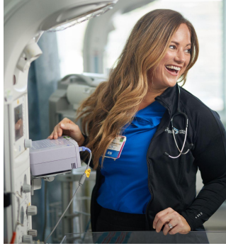
کله چې تاسې امیدواره واوسئ