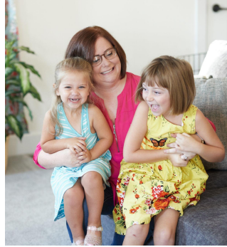
وروسته له دې چې تاسې ماشوم وزیږوئ