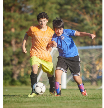
کله چې ستاسې ماشوم را لوی شي